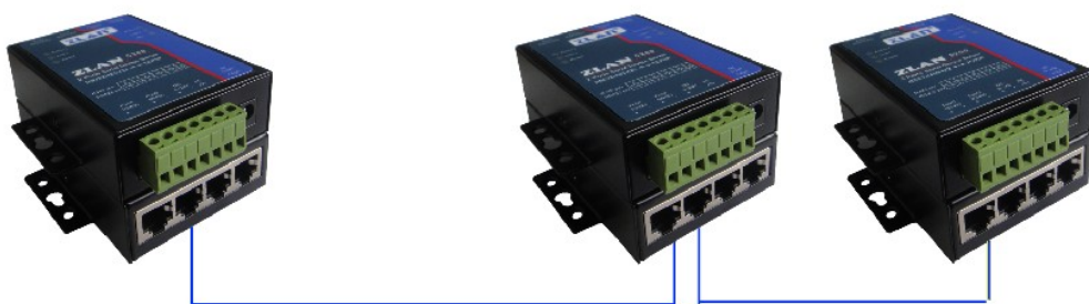
图 7 ZLAN5240 级联方法