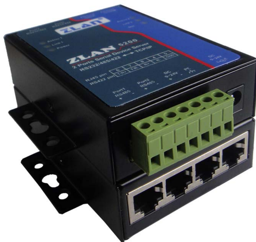
图 1 ZLAN5240 串口服务器

ZLAN5240 串口服务器是上海卓岚信息科技有限公司开发的一款 2 串口 RS232/485/422 和 TCP/IP 之间协议转化器。同时支持 Modbus TCP 转 Modbus RTU 功能。ZLAN5240 支持 2 个 RS232 串口、2 个 RS422/485 串口，通过一根网线连接到 ZLAN5240，实现 2 个串口同时全双工工作。其中 RS485 接口是绿色接线端子接口，RS232/RS485 为 RJ45 网口接线接口。卓岚可配备 RJ45 转 DB9 线，2 根此类线接上 2 个 RJ45 的 RS232 接口可以引出 2 个 DB9 公头 RS232 接头。另外 5240 提供有额外以太网接口一个，可作为交换机或者级联使用。ZLAN5240 支持通过级联网口扩展为 4 串口、6 串口、8 串口。5240 提供电源插座和接线端子 2 种电源接入方式，宽电压范围，且提供外壳地接线保护。